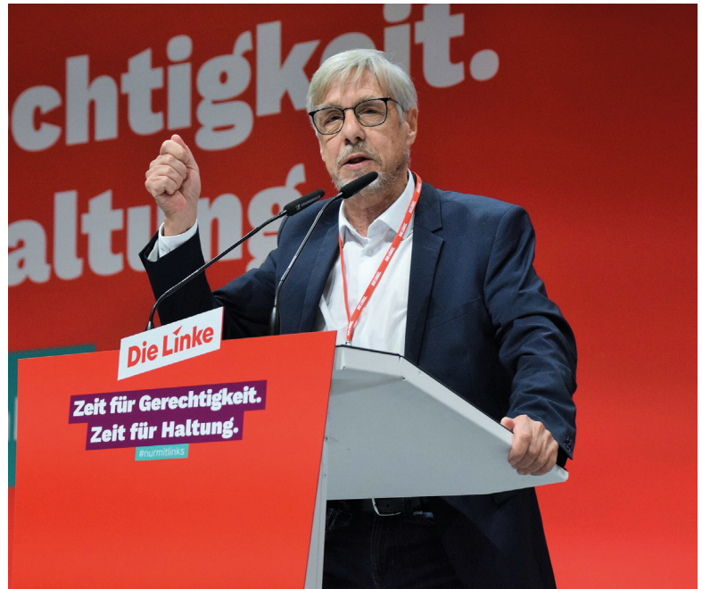
Walter Baier zu Gast auf unseren Parteitag in Augsburg

Baier drängte darauf, dass der Kampf gegen den Klimawandel von sozialen Verbesserungen begleitet werden muss und unterstützte den Europäischen Gewerk-