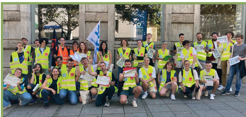
Stuttgarter Genoss:innen beim Start der Kampagne letztes Jahr

Wir unterstützen als Gemeinderat die Forderungen von ver.di und den streikenden Beschäftigten bei der VBK und im gesamten Nahverkehr für bessere Arbeitsbedingungen und höhere Löhne.